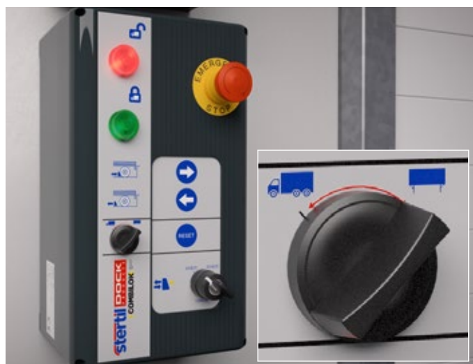
Schakel van afzetbak naar vrachtwagen

Het optionele Stertil veiligheidscircuit maakt een veilige synchronisatie mogelijk tussen de leveller, dockdeur en verkeerslichten.