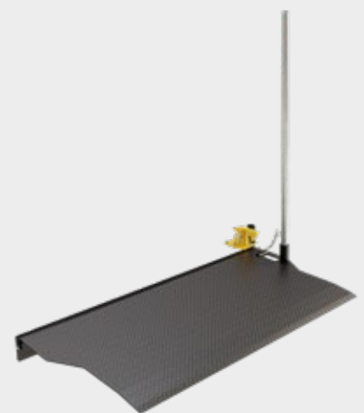
Van Bridge Plate Dock Leveller