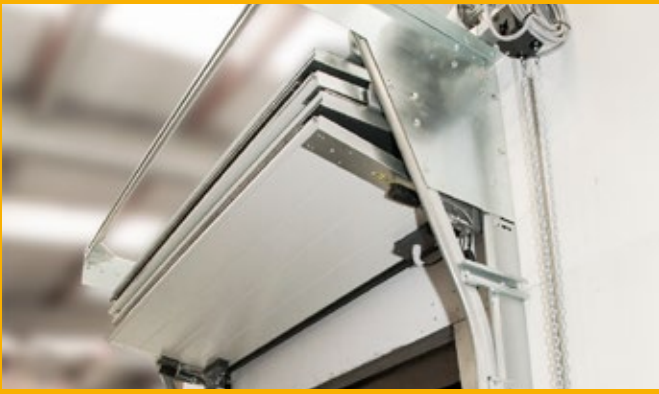
Slim ontworpen vouwdeur