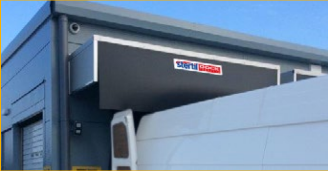
Speciaal ontworpen afdak tegen wind en regen