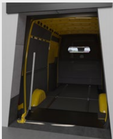
Leveller gezien vanuit magazijn

Een opblaasbaar bovenkussen geschikt voor kleinere bestelwagens zorgt voor een optimale afsluiting en minder temperatuurschommelingen of tocht tijdens het laden en lossen.