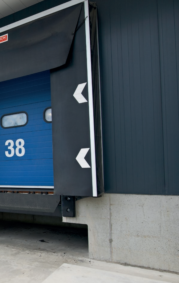
Fixed frame (WSP)