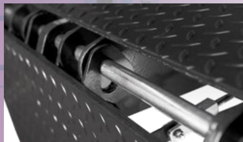
Charnière de lèvre ouverte exclusive