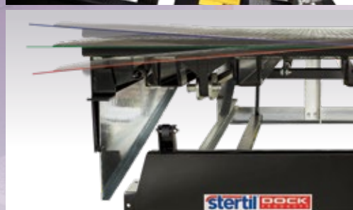
Le plateau est inclinable de 125 mm des deux côtés