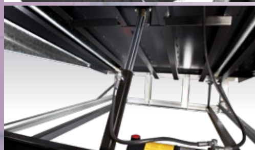
Un vérin hydraulique (principal)