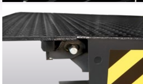
Lèvre horizontale dans toutes les positions