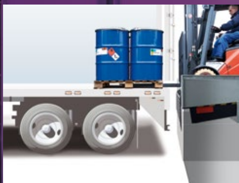
Commande en dessous du quai