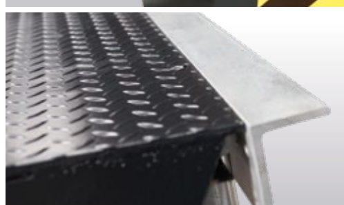
Charnière arrière fermée