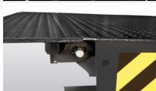
Altijd horizontale lip