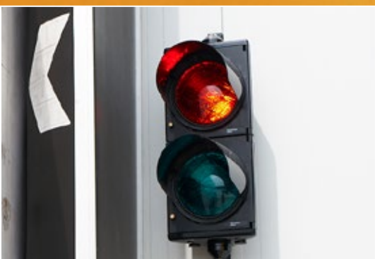
Signalisation optique et acoustique.