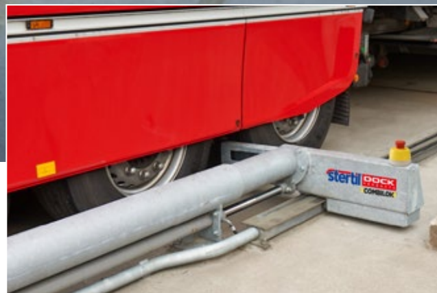
La faible hauteur du cale-roue évite tout dommage aux garde-boues ou aux jupes latérales.