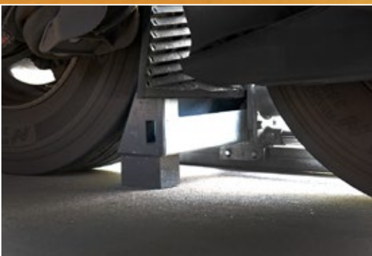
Le processus de blocage du camion : 30 secondes