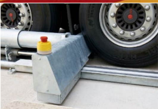
Le cale-roue applique une pression constante contre la roue pour éviter que le véhicule n'avance.

universel. Par ailleurs, il n'existe pratiquement aucune restriction en matière d'installation, car le système s'installe intégralement au-dessus du sol. Ainsi, le véhicule ne rencontre aucun obstacle et aucun contact n'est possible avec les camions en mouvement. Seules les roues sont guidées le long des tubes ronds, au bas du camion. Le bas du véhicule et les essieux demeurent libres à tout moment.