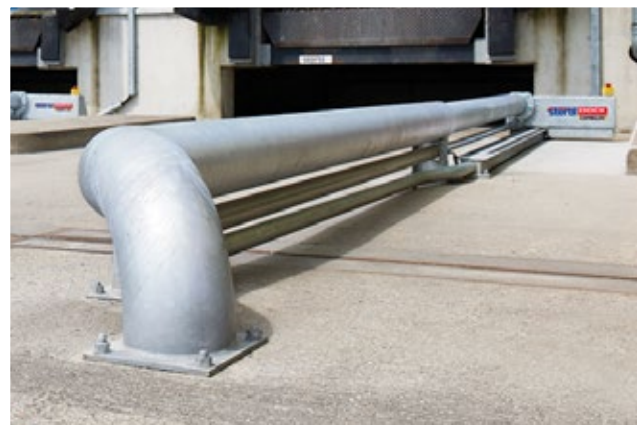
Installation facile au-dessus du sol.